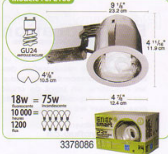
Modèle : CFL100