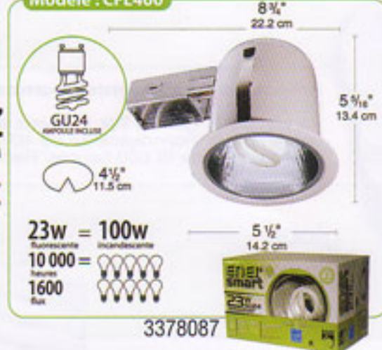
Modèle : CFL400