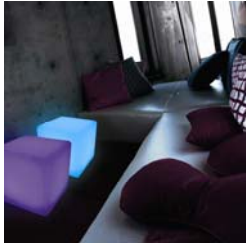
Cube au DEL – int./ext.