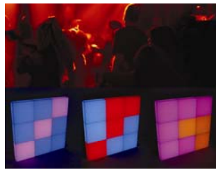
Panneau au DEL – sensible au son