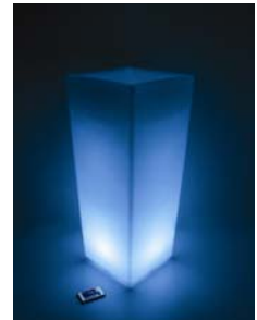
Pot de fleur au DEL – int. /ext.