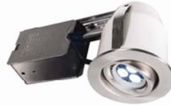
Lampe encastrée au DEL